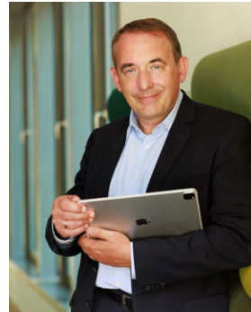
Prof. Dr. R. Alexander Lorz Hessischer Minister der Finanzen